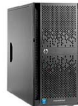
ProLiant ML150 Gen9