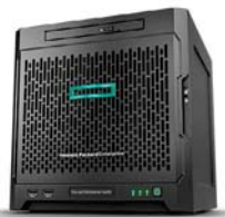
ProLiant Microserver Gen10