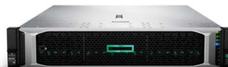
ProLiant DL380 Gen10