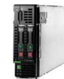
ProLiant BL460c Gen9