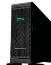
ProLiant ML350 Gen10